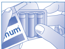
1 - Sortir la barquette de 3 doses de l'étui.